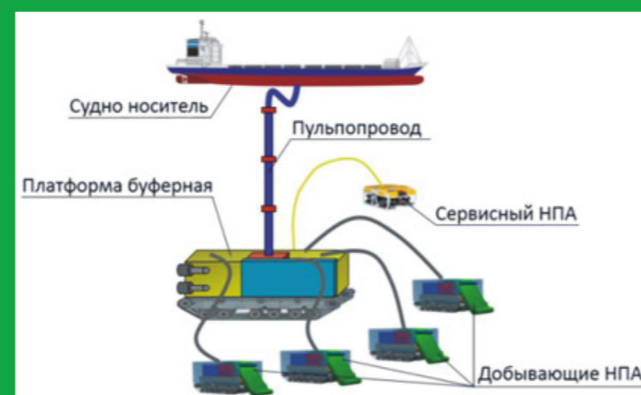
Пример исполнения добывающего комплекса с группой добывающих ТНПА на поле ЖМК