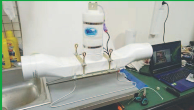
Внешний вид регистратора планктона для мелководья «АКВАСКОП»